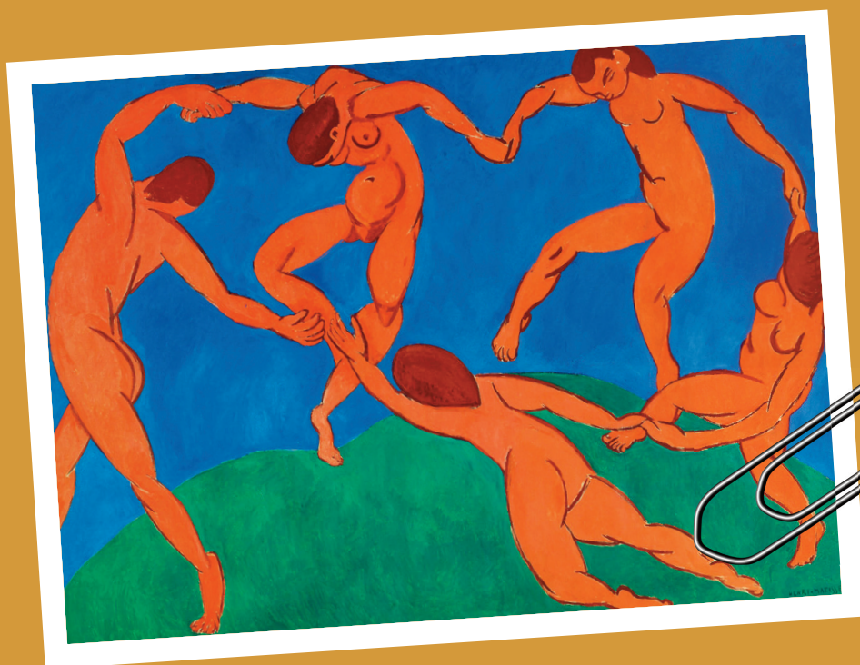
ICONA DEL SEMINARIO La danza di Matisse II (1909-1910)

docente di teologia presso lo Studio Teologico Interdiocesano di Reggio Emilia